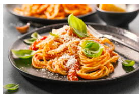
Pasta mit Tomatensauce