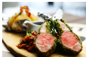
Lammfleisch mit dunklen Saucen