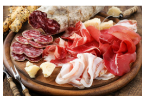
Viande et charcuterie