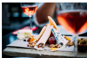
Weichkäse aus Kuhmilch