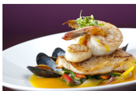
Gebatene und gegrillte Meeresfrüchte, auch mit Saucen