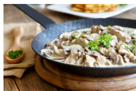
Kalbfleisch mit dunklen Saucen