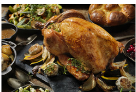
Volaille avec sauce foncée