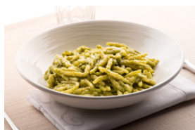
Pasta mit Pesto