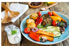
Délicieux avec différents légumes