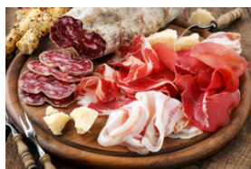
Viande et charcuterie