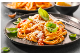
Pâtes avec viande