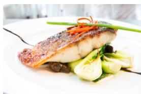
Gebratener oder gegrillter Fisch