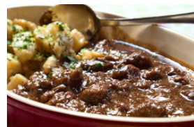
Wildfleisch mit dunklen Saucen, auch gegrillt oder gebraten