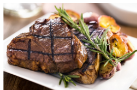
Rindfleisch mit dunklen Saucen, auch gegrillt oder gebraten