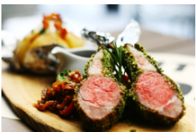
Agneau grillé ou rôti