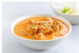
Rindfleisch mit dunklen Saucen Curries