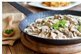
Veal in a light sauce